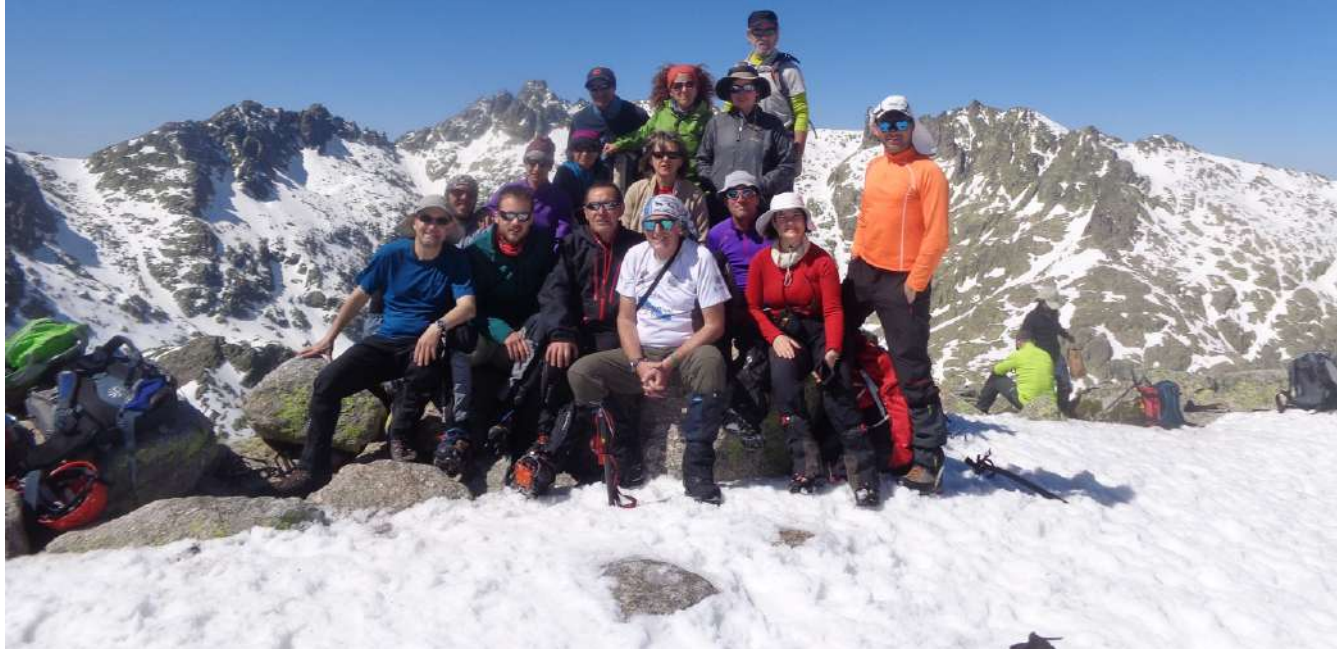
Texto e foto: Federico Rodríguez

Uns días maravillosos nos acompañaron nos cumios máis destacados de Gredos, o Casquerazo, o Almanzor, a Galana e o Morezón deixáronse subir na pasada Semana Santa.