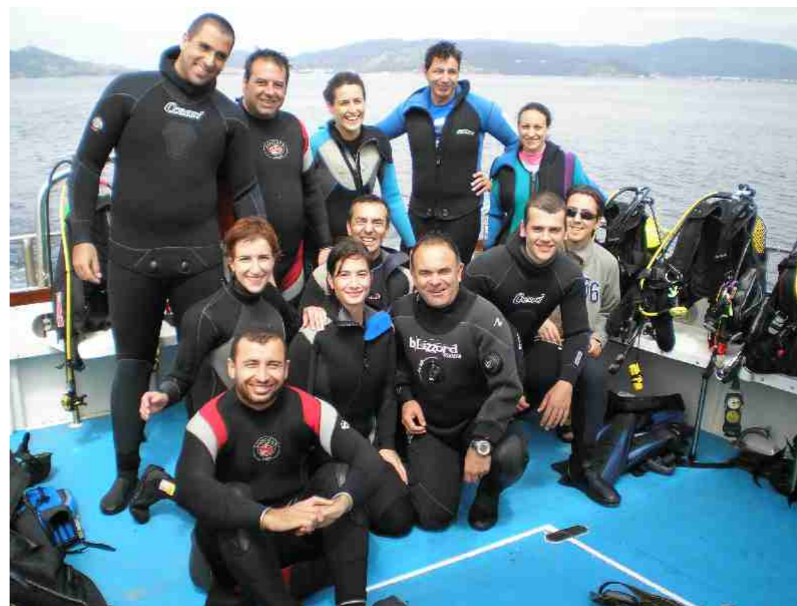
Porto do Son