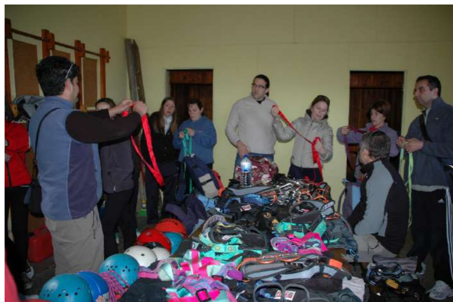
Club Montañeiros Celtas

axudan". Despois uns peor que outros fomos chegando a cumio,algúns con cara de susto, outros case sen alento, e outros cun sorriso de orella a orella.