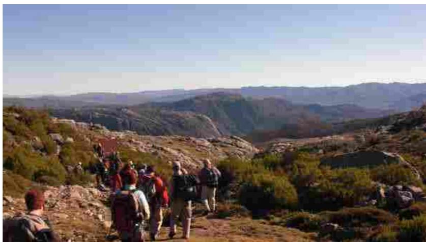
Club Montañeiros Celtas