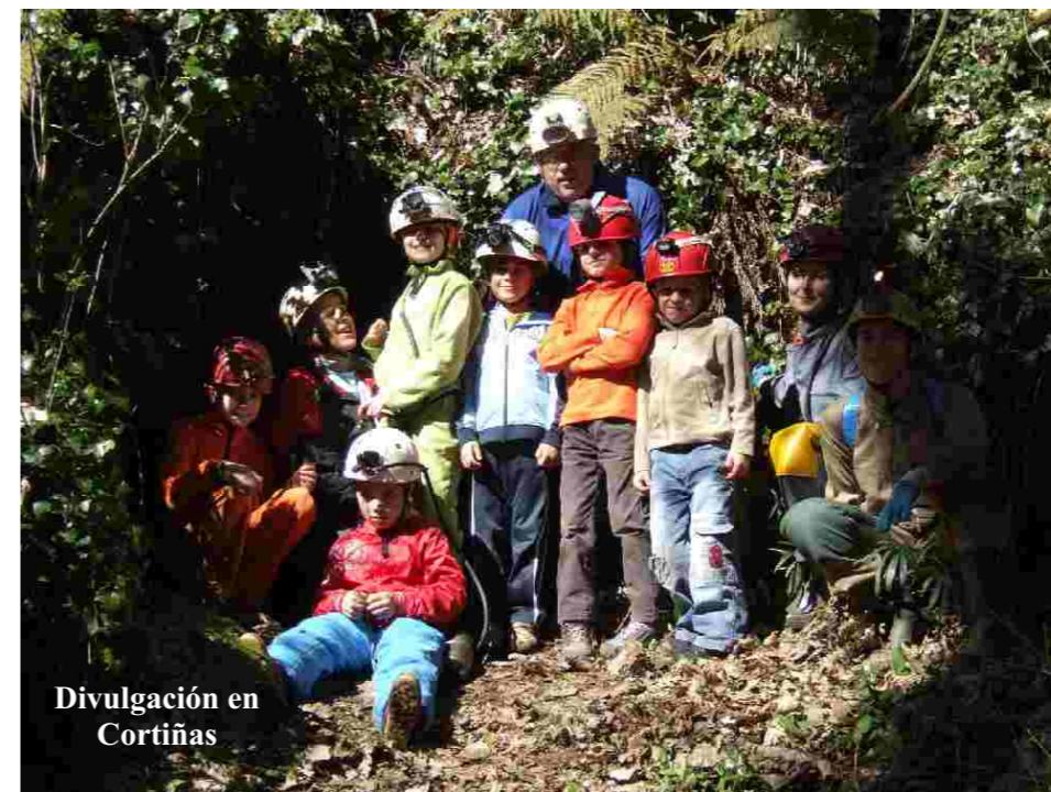
Divulgación en Cortiñas

6 xullo. Achegamento descenso de canóns. Melón