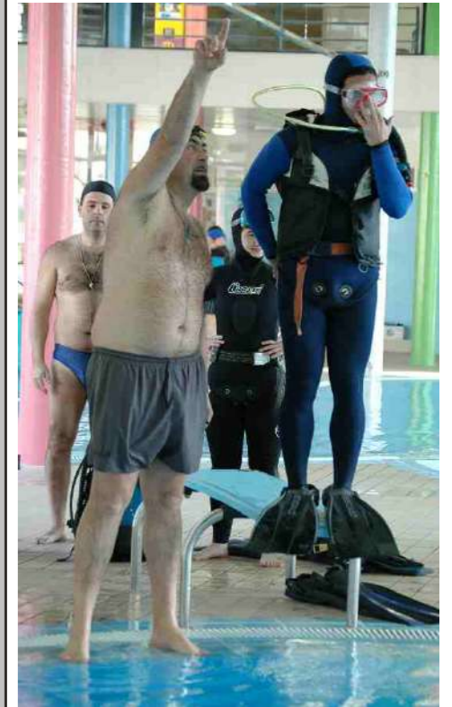
Un participante do último curso de mergullo na piscina de Valença

A finais de ano, e para intentar impulsar esta disciplina, organizaremos una inmersión nocturna tamén nas Illas Cíes. É imprescindible ter o título de mergullador avanzado ou a especialidade de mergullo nocturno da FEGAS