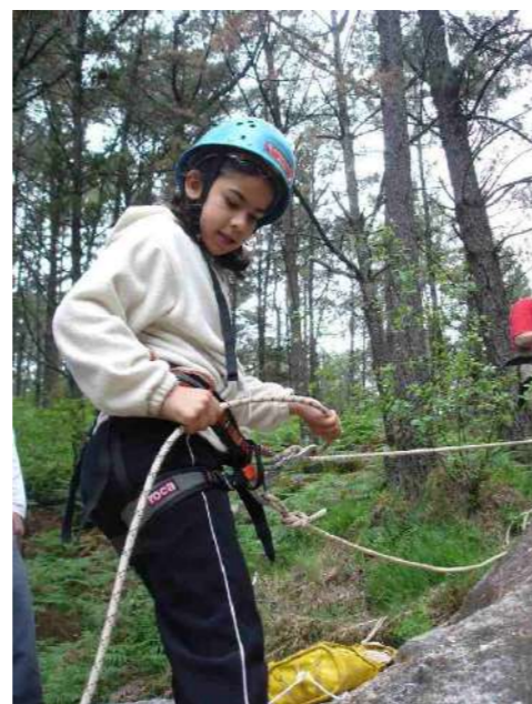
Unha nena participante da operación benxamín