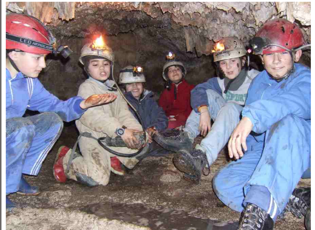
Actividade infantil: Coñece as Covas

Acordádevos que os xoves no Club falamos, do que queiramos, e tamén do que imos facer a fin de semana.