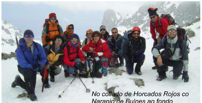
No collado de Horcados Rojos co Naranjo de Bulnes ao fondo