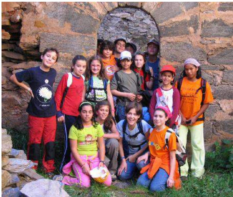
O grupo no Castelo