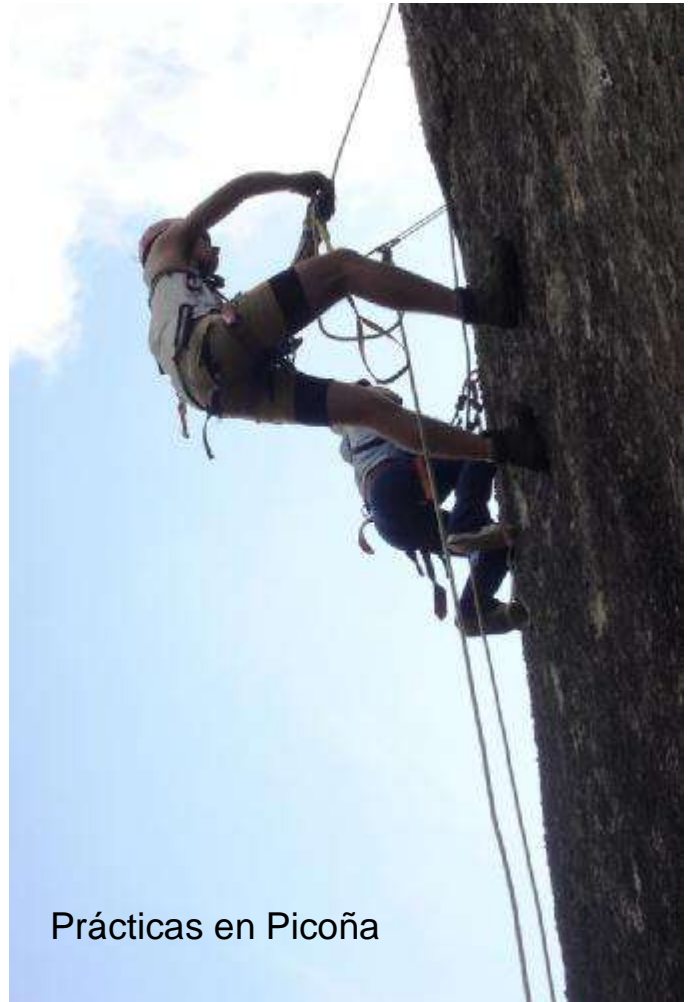
Prácticas en Picoña