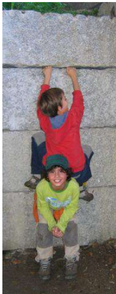
“Cordada de dous” nas prácticas de escalada

Saída de Vigo coma de costume ás 9.00 h e dende o Club. Breve parada nun bar cun pequeno parque infantil no que rapidamente gozamos dos balancíns colectivos. Chegada ao albergue de Quiroga sobre as 12.00 h. Distribución das habitacións, acomodo da equipaxe e preparación da mochila de ataque. Ás 13.00 h pequeno percorrido pola beira do río ata unha área de descanso onde comemos cun agradable sol de mediodía. Xogos ao aire libre (comba, voleibol sen rede, pequenas escaladas nunha parede de bloques...) na área recreativa do paseo. Ás 16.00 h o autobús acercounos ao inicio da Ruta da Encomenda, marcha duns 5 Km. polo bosque autóctono do Caurel (castiñeiros, carballos, algún acivro...). De camiño visita ás ruínas dun castelo medieval, cunha historia de amores trágicos e pasadizos secretos que algún neno grande escenificou e algún outro chamou de Romeo e Xulieta. Volta ao albergue sobre as 19.00 h. Tempo de lecer na sala de xogos. Cea ás 21.00 h, por conta da organización: lentellas, luras fritidas, san-xacobe con patacas fritidas e xeadó. Xogo en grupos sobre a flora e fauna do Caurel. Deitámonos sobre as 23.30 h.