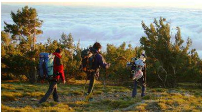
Regreso dende o Refuxio Poqueiras a Capileira