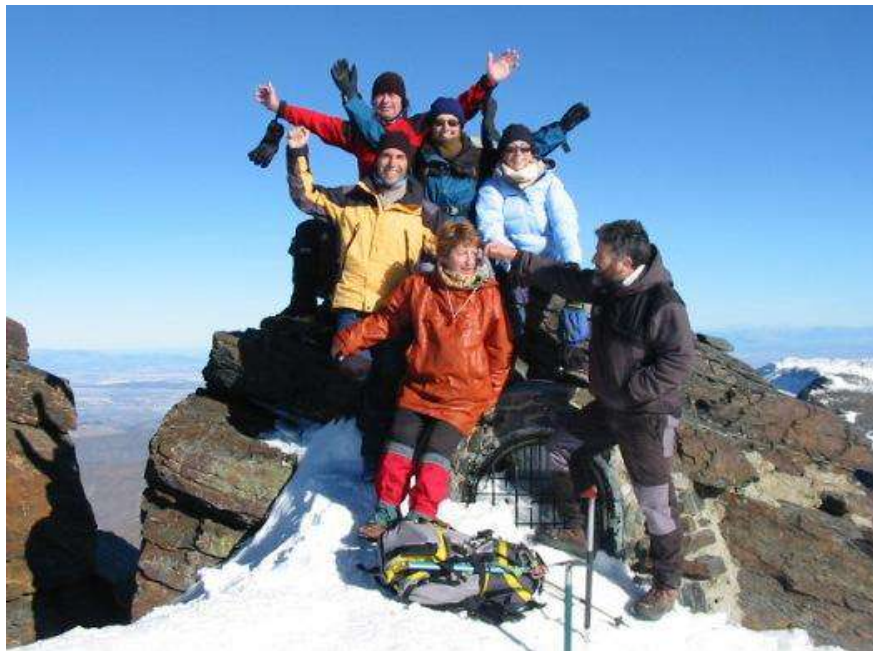
Grupo no Mulhacén

Cansos, xa de regreso no refuxio non estamos moi seguros de se á mañá seguinte faremos o Veleta, inda que nos dura pouco, uns empurrando aos outros (máis ben pouco, todo hai que dicilo), o cuarteto que quedamos decidimos que á mañá seguinte se madrugaría un pouco máis para poder chegar ao cumio nas mellores condicións.