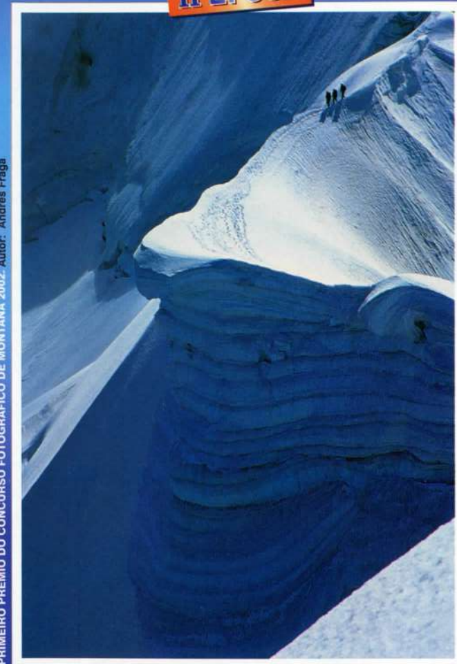
PRIMEIRO PREMIO DO CONCURSO FOTOGRÁFICO DE MONTANA 2002.